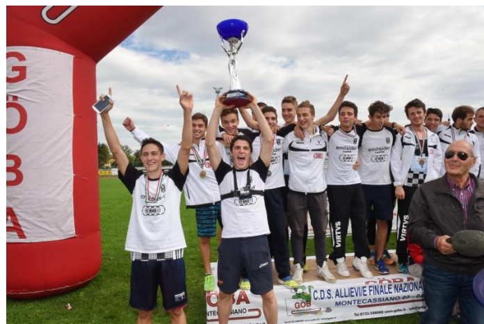
Successo al maschile per la Sef Virtus Emilsider Bologna