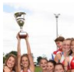
La premiazione per le allieve dell'Atletica Avis Macerata