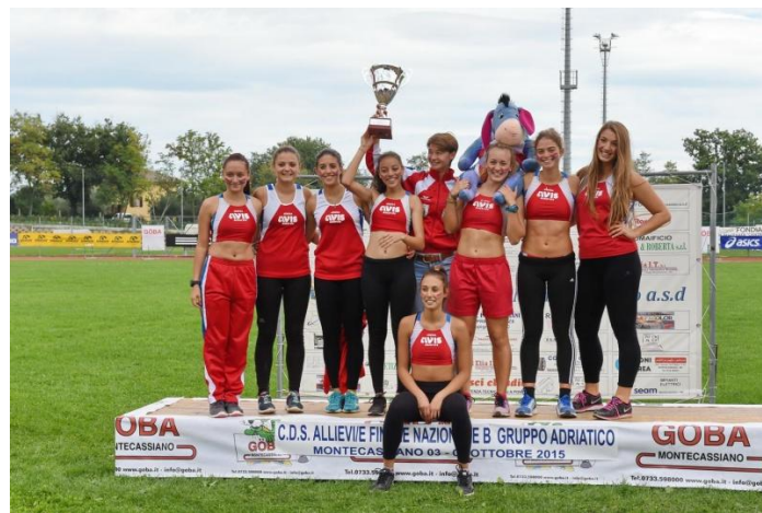
Atletica Avis Macerata sul podio